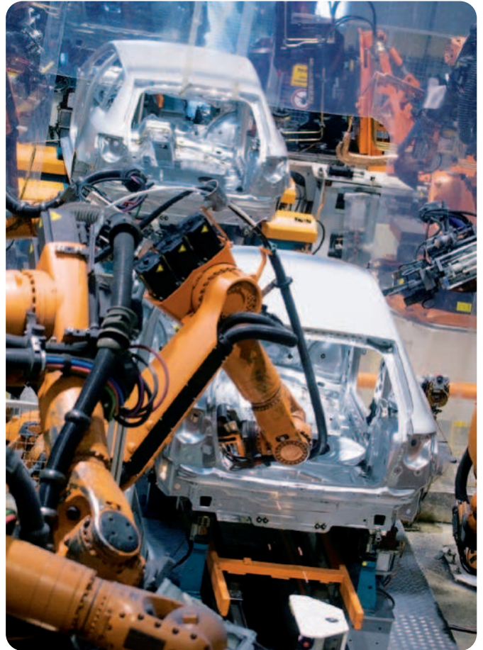
SKF Straight Side Plate Chains used in the automotive industry

SKF Straight Side Plate Chains possess flat, rather than contoured link plates, for better sliding properties in conveyor applications. The fatigue strength and chain weight are slightly higher than for standard chains.